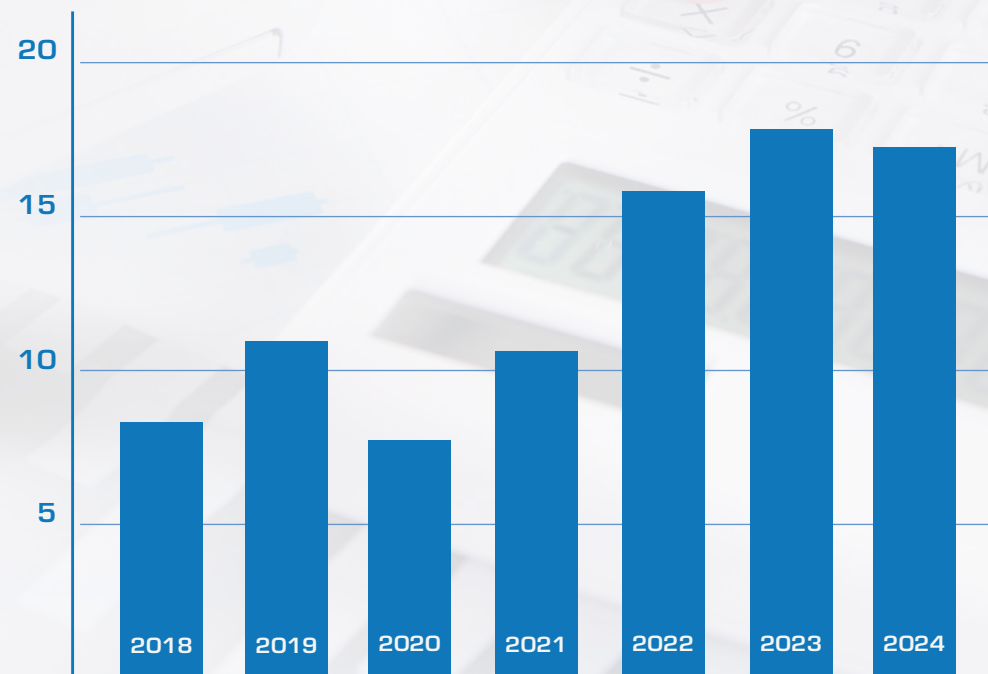
Koncernomsætning 1. halvår mio. DKK