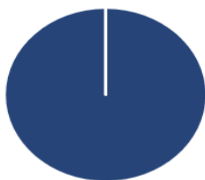
2. Investeringer i overensstemmelse med EU-klassificeringssystemet inkl. statsobligationer*