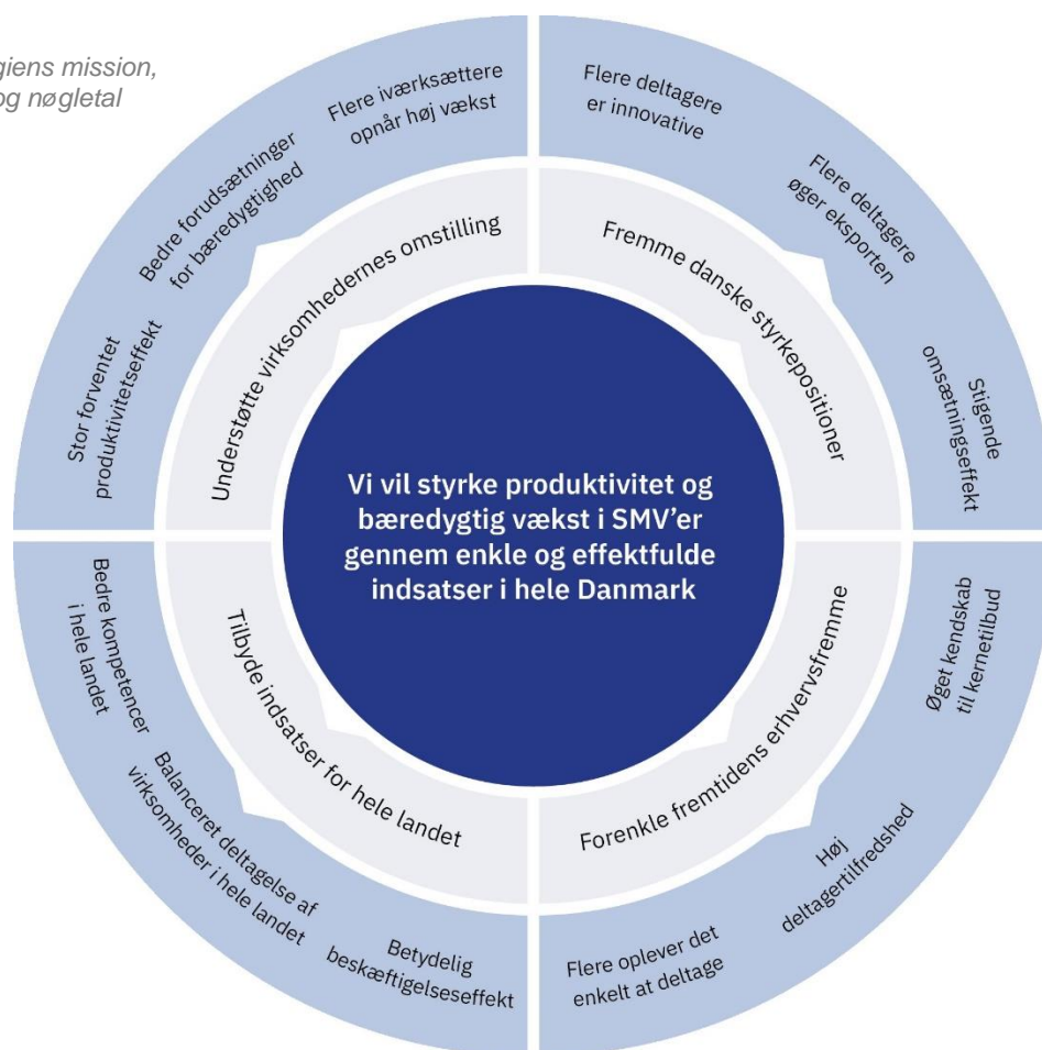
Figur 1: Strategiens mission, målsætninger og nøgletal

Med strategien opstilles fire klare målsætninger med 12 tilhørende nøgletal for indsatserne. Af målsætningerne følger det, at indsatserne 1) skal understøtte virksomhedernes aktuelle behov og omstilling; 2) at de skal bidrage til at styrke danske styrkepositioner; 3) at de skal være lette at finde og anvende for virksomhederne; og 4) at de skal gavne hele landet. Realiseringen sker primært via syv signaturindsatser, som der udvikles og investeres kontinuerligt i med udgangspunktet i tydelige udviklingsspor for de enkelte indsatser.