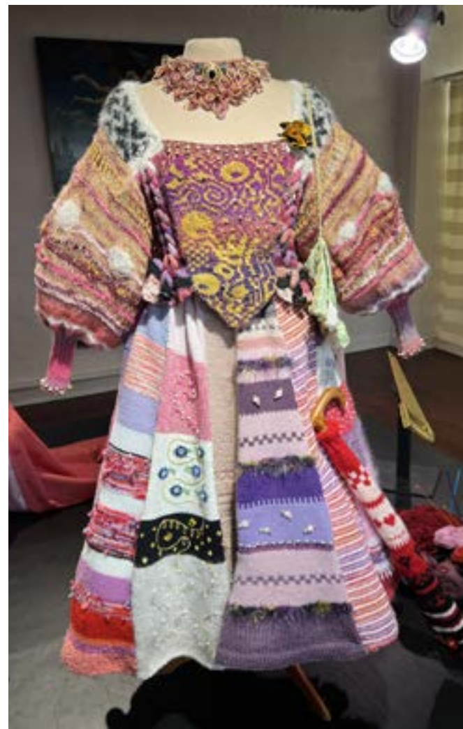
Strikkekjolen, Danmarks Kostumarium