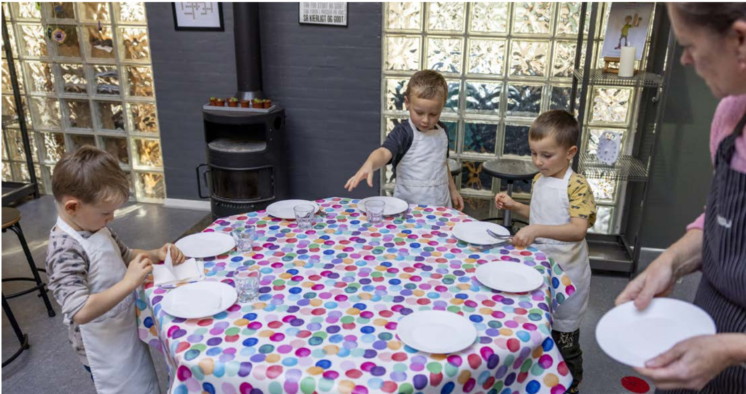
Børnene, der har køkkentjansen, dækker også bord

Hvad er forskellen på knold- og bladselleri? Til hvilken side skal kniven ligge? Og hvad er god hygiejne i et køkken? I Børnehuset Møllehøj hjælper børnene til ved måltiderne, og det er lige fra at snitte grøntsager til at dække bord og hjælpe med opvasken. Det er der nemlig god læring i.