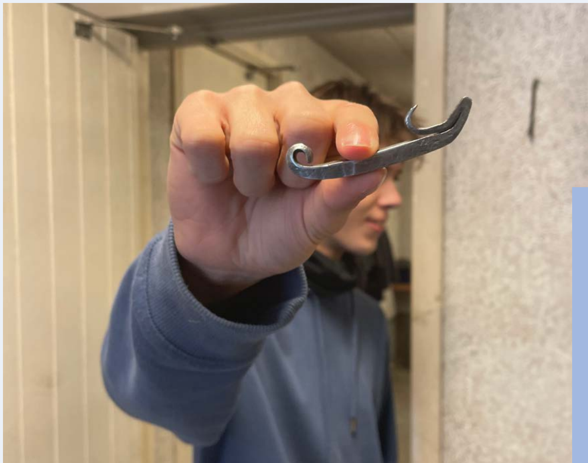
Eleverne laver mange forskellige ting ud af jern. Her er det fx en oplukker.

Undervisningen er flyttet fra de vante klasseværelser i Almind og ud i naturen lidt uden for Bjerringbro.