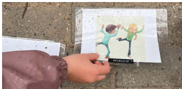
Når et punkt på dagens samling er overstået, vendes kortet.

Samlingen slutter fast med et billede af en kop. Børnene går på skift hen og henter deres kop, inden de skal spise.