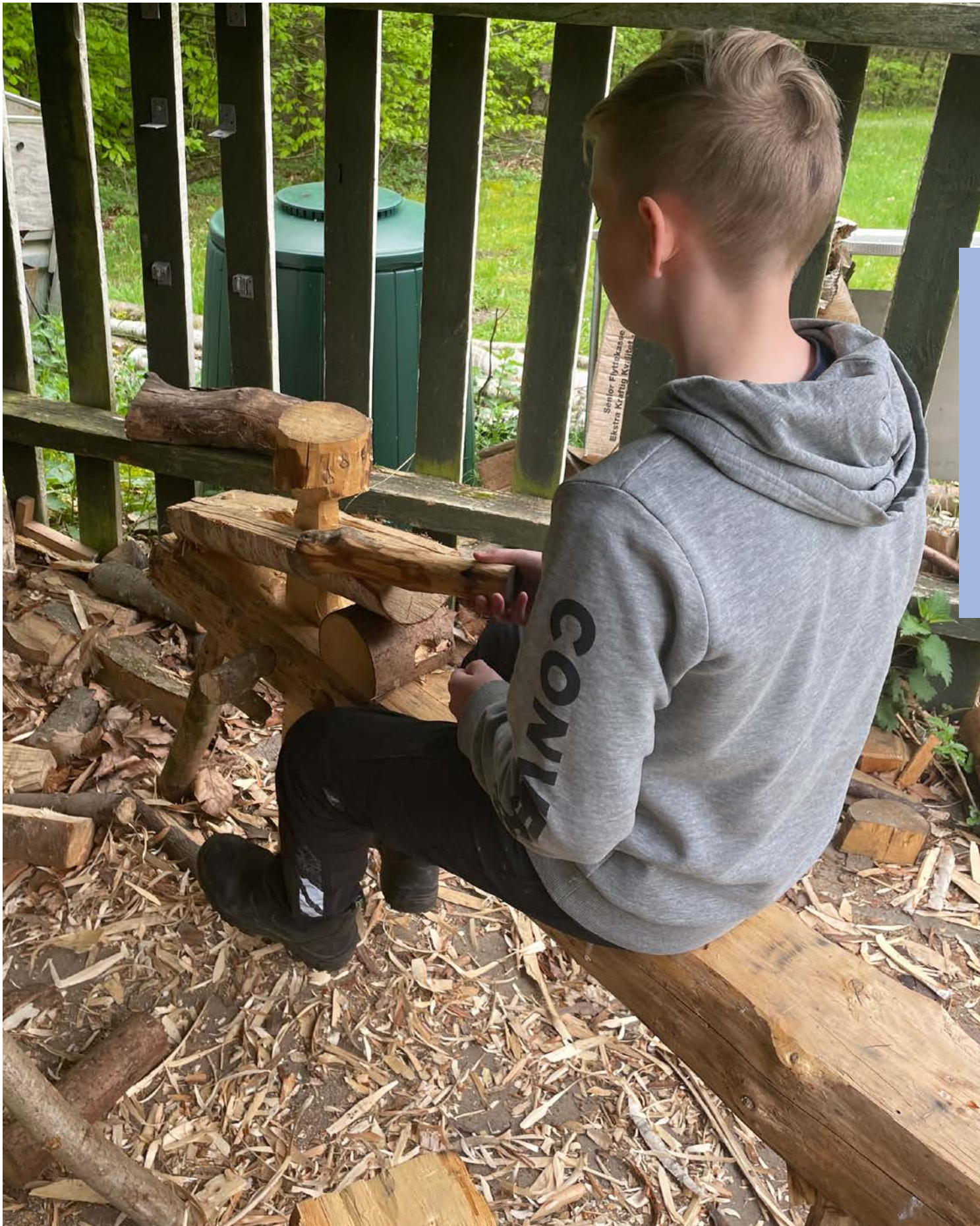
Eleverne laver mange praktiske opgaver i løbet af skoledagen.