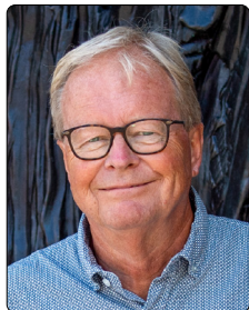
Borgmester Ulrik Wilbek