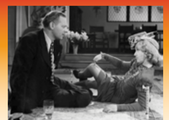
En feteret skuespiller i clinch med fire ekoner. Mine kæreste og fire ekoner (1943).