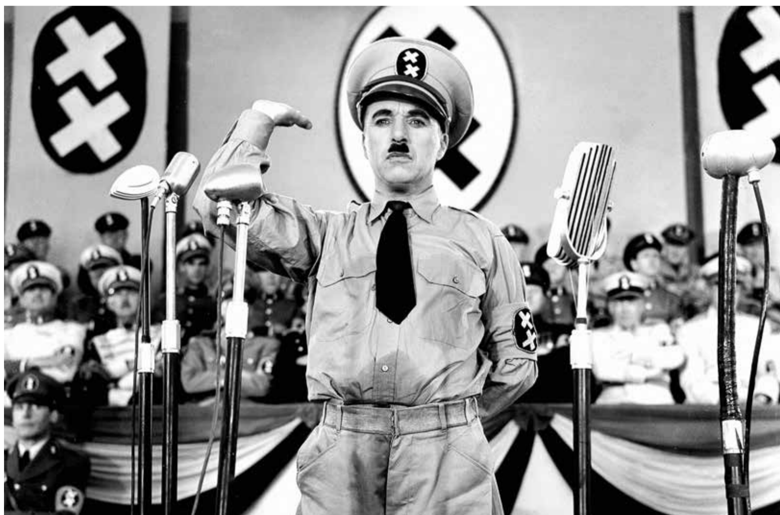
Heil Hynkel! Stram retstilling, velkendte symboler, som drejes en knap, så det truende bliver komisk. Charlie Chaplin i sit livs modigste filmrolle, Diktatoren (1940).