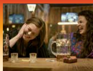
Grinende venner i Velling. Meter i sekundet (2023).

Krimikomedie med Anders Thomas Jensens faste crew. Retfærdighedens ryttere (2020).