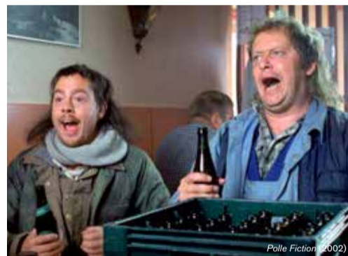
Polle Fiction (2002)