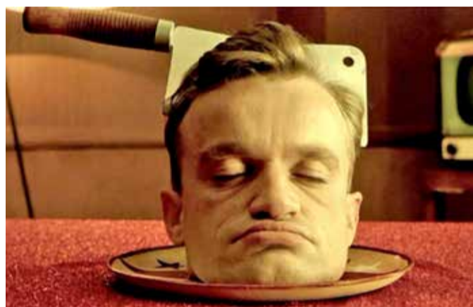
Hovedretten er serveret! Spisetid i den kannibalistiske komedie, Delicatessen (1991).