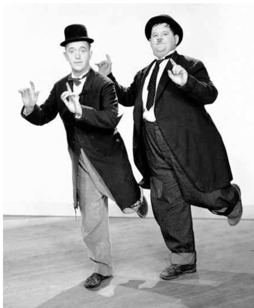
Gøg og Gokke i komisk posur. Et af filmhistoriens ældste komiske makkerpar. Morsomme modsætninger er evergreens på film. Fy og Bi er det danske modsvar, en høj og ranglet, en anden lav og tæt.

Læs mere om Filminstituttets fokus på filmhumor.