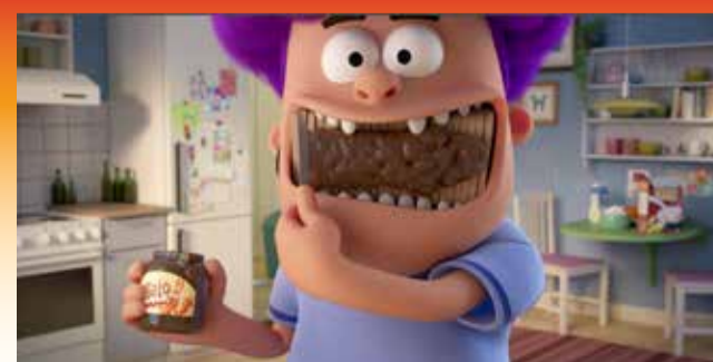
Mugge er virkelig mærkelig, og det kommer der komik ud af. Mugge og hans mærkelige hjerne (2022).