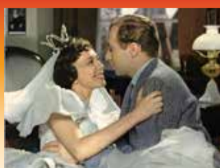
Den første komedie med kulør på. Kispus (1956).

Dansk komedie blev Dirch, Dirch, Dirch og Dirch. Her i Det var på Rundetårn (1955) og i Vi er alle sammen tossede (1959).