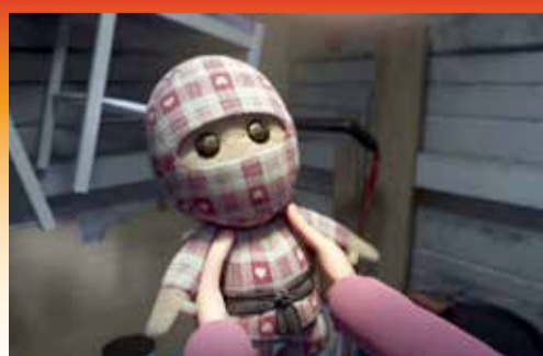
En ternet ninja ikke længere i ægte cashmere. Ternet Ninja 2 (2021).