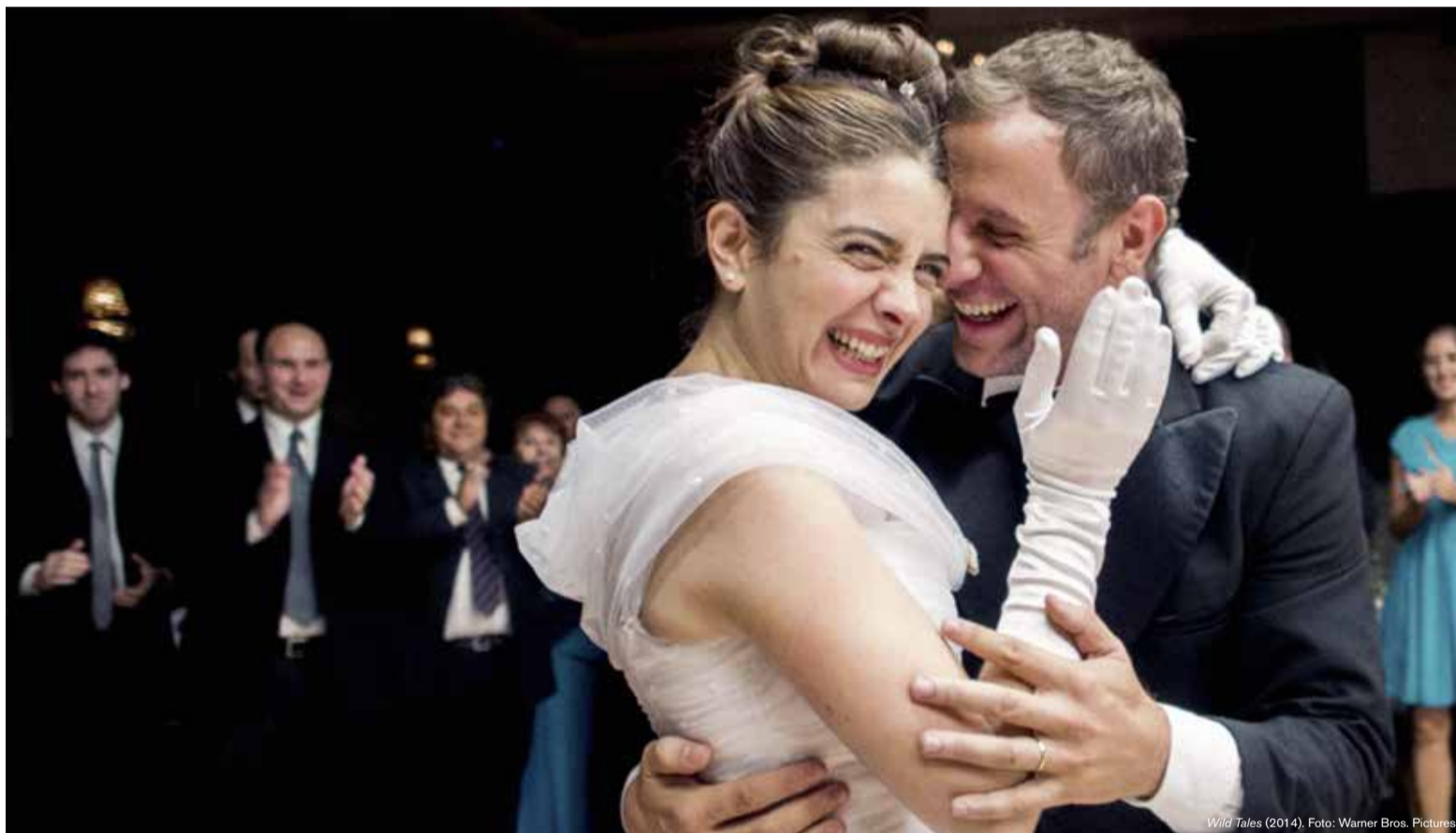
Wild Tales (2014).