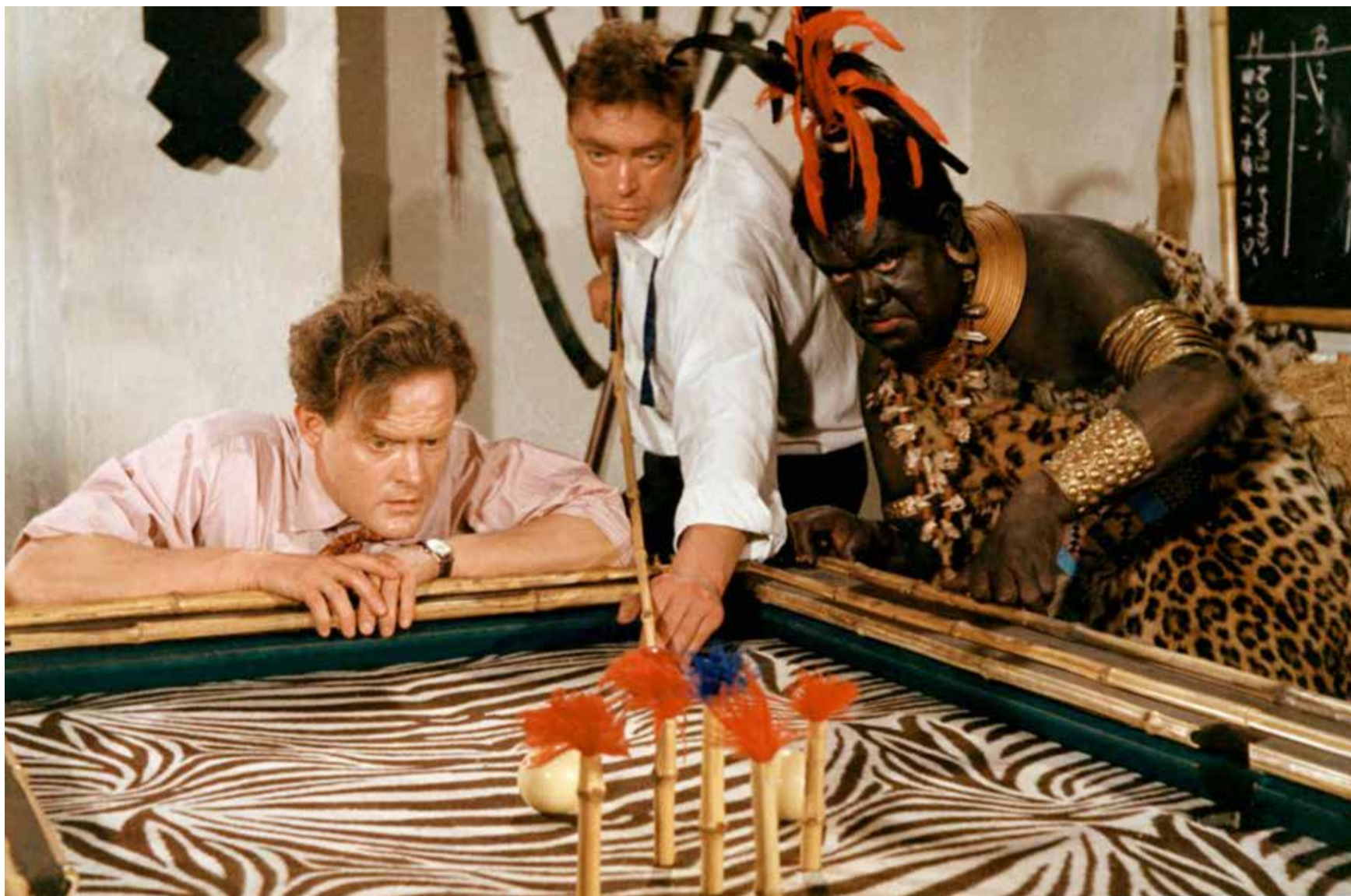
Tre af dansk films store komiske skuespillere omkring billardbordet. Karl Stegger som sortsøvret Karl Stegger og stammehøvding var sjov i datidens optik. Styrmand Karlsen (1958).