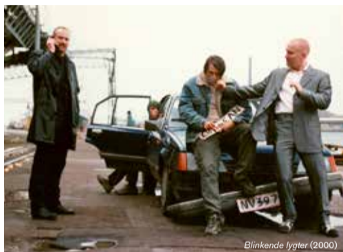
Blinkende lygter (2000)