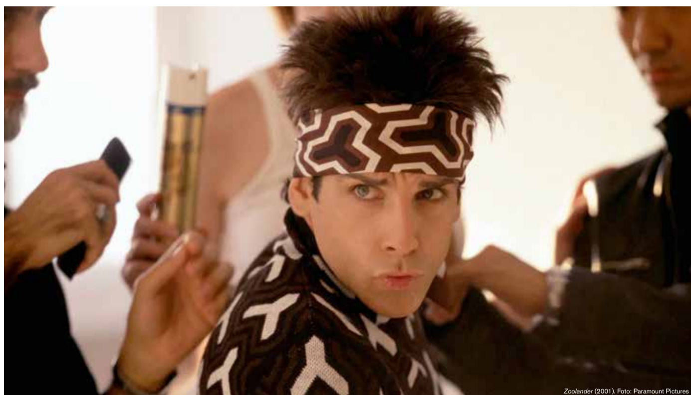
Zoolander (2001).

Gigis har valgt deres sjoveste yndlingsfilm til en serie i Cinemateket. Se dem her.