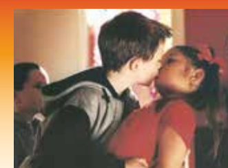
Bagover med hende, og smak! Det allerførste kys i Bror, min bror (1998).