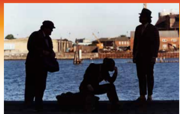
Olsen-banden på sporet (1975).