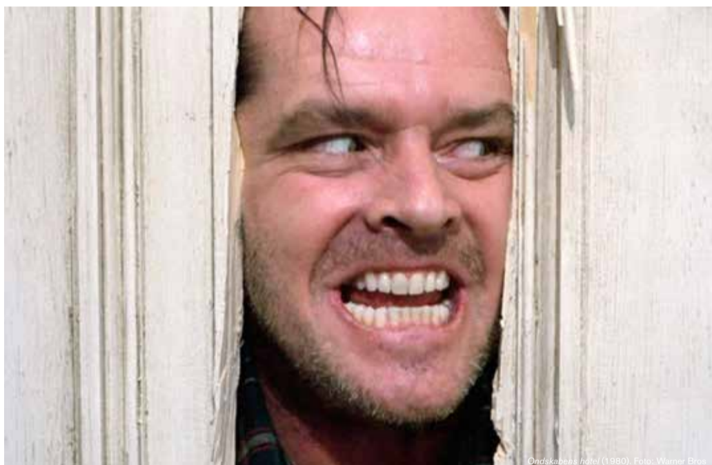
Ondskabens hotel (1980).