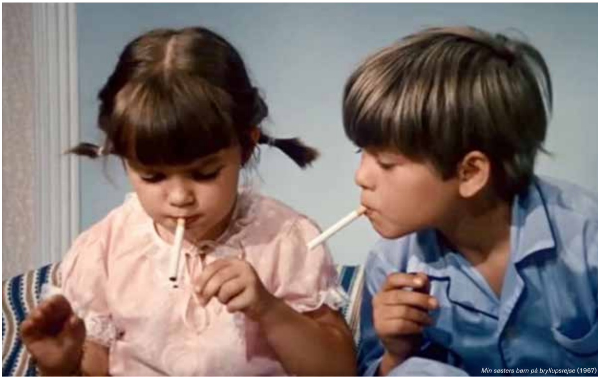
I den folkekære serie om Min søsters børn går ungerne frisk til både bajere og smøger. For det er vel sjovt at se de kære små slå sig løs?