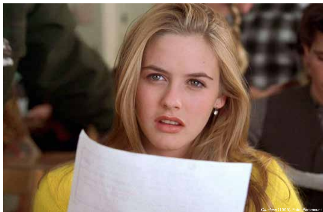
Clueless (1995).