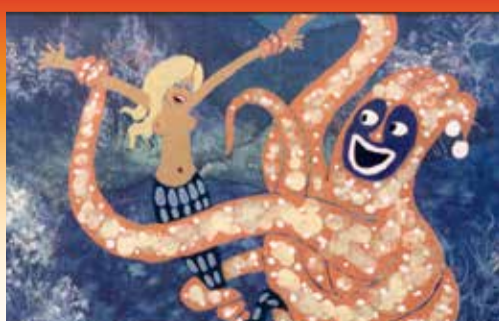
Syngende sprutter og havfruer bolttrer sig i Bennys Badekar (1971).