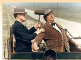
Det var skidegodt, Egon, gennem flere årtier. Her er Olsen-banden i Jylland (1971) og i karakteristisk profil i Olsen-banden på sporet (1975).