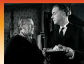
Oscar-nomineret som bedste udenlandske film. Harry og Kammertjeneren (1961).

Så er der total nabokrig af den komisk-satiriske slags. Naboerne (1966).