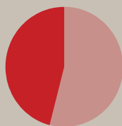
Antal tobaksposer per dag