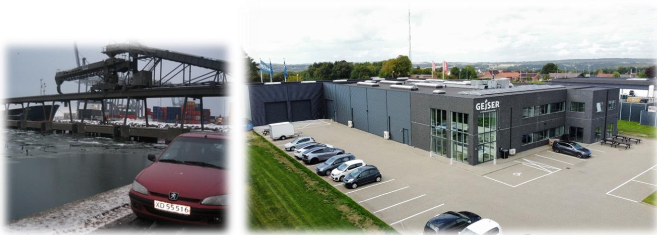
Fra Bagagerummet i en gammel Peugeot 106 til stort hovedkontor og lager i Galten, Midtjylland