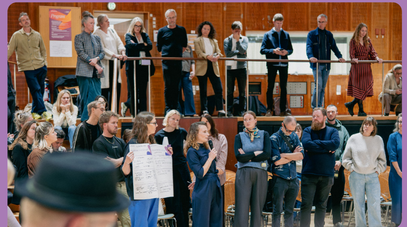
Partnerskabets branchedag 2025.

I 2025 udgav partnerskabet sin anden rapport om lige adgang og trivsel baseret på data fra 79 aktører. Rapporten opgør data på sektorniveau og dokumenterer blandt andet kønsbalance på ledelsesniveau og blandt skabere og udøvere og bidrager til et styrket beslutningsgrundlag for arbejdet med ligestilling og trivsel.