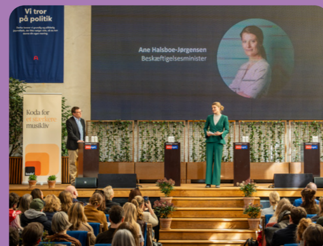
Daværende beskæftigelsesminister Ane Halsboe-Jørgensen ved lancering af rapporten 'Barsel i musikbranchen'.

Barselsalliancen fortsætter i 2026 med henblik på at omsætte de politiske forslag til konkrete forbedringer af barselssystemet og for at styrke barselsvilkårene for musikskabere og andre i de kreative erhverv.